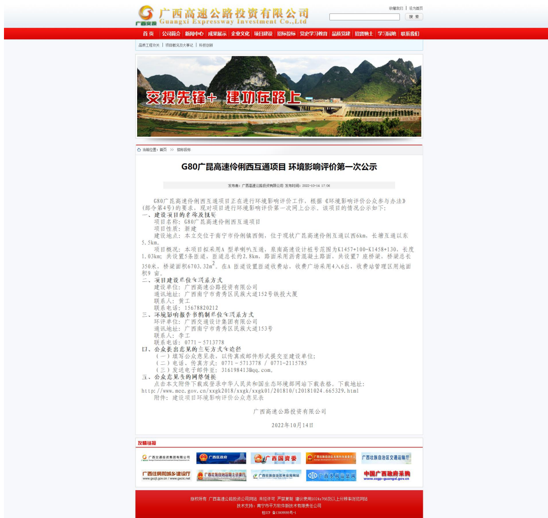
图 1 本项目首次环境影响评价信息网上公开截图

我公司在广西高速公路投资有限公司（ http://gxgsgl.com/106/20221014170658_2927.html ）上公开了本项目的首次环境影响评价信息，公开信息截图见图 1。