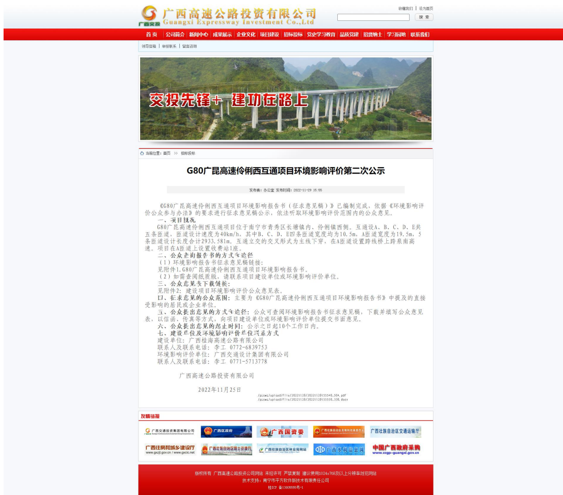
图 2 本项目环境影响报告书征求意见稿网上公示截图