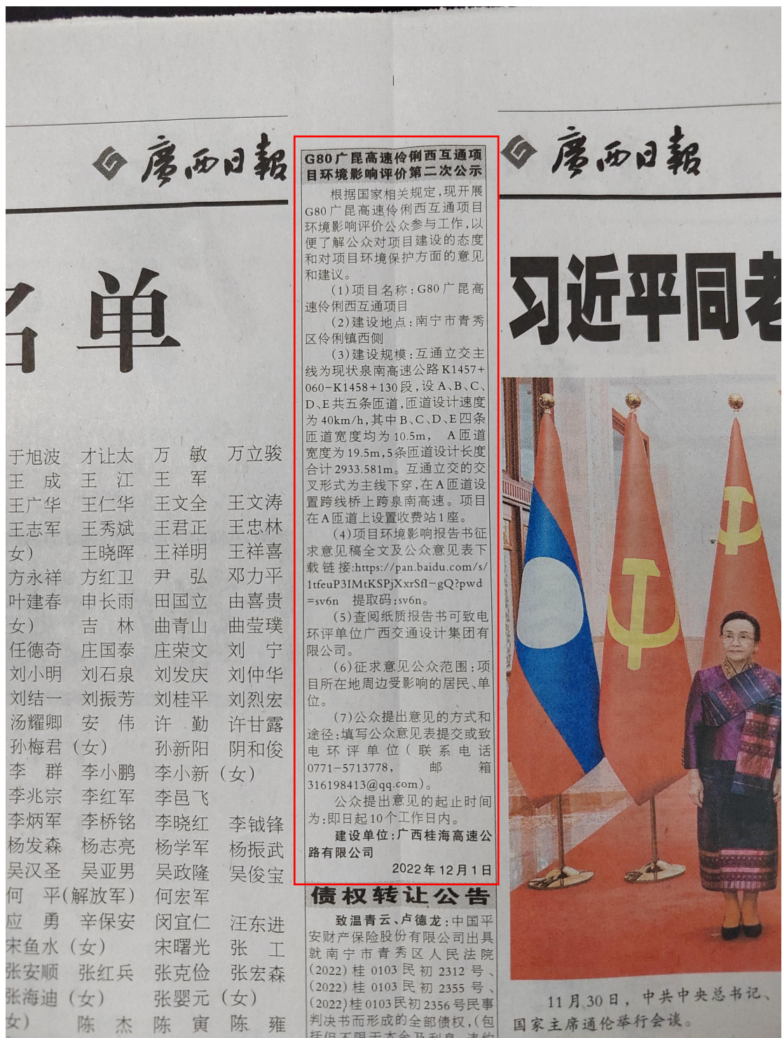
图4 本项目环境影响报告书征求意见稿登报公示照片(第2次)